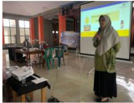
Gambar 5. Penyuluhan Destilasi Minyak Atsiri Buah Adas