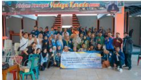
Gambar 3. Nuansa kegiatan pengabdian masyarakat di Desa Ngadisari- Probolinggo

ini dilakukan dalam 4 sesi, yaitu pada sesi pertama diberikan “Penyuluhan destilasi minyak atsiri,” sesi kedua diberikan “Pelatihan destilasi minyak buah adas,” sesi ketiga “Penyuluhan aromaterapi,” dan sesi keempat adalah “Pelatihan pembuatan lilin aromaterapi”.