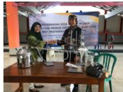
Gambar 6. Penyulingan minyak adas (a) dan penyerahan alat destilasi sederhana