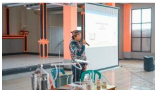
Gambar 4. Sambutan Ketua Karang Taruna