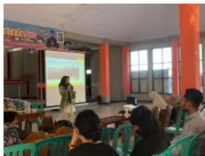
Gambar 7. Penyuluhan Aromaterapi