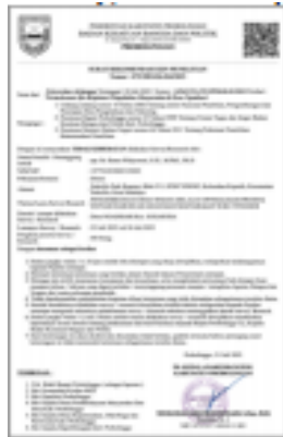
Gambar 2. Surat perijinan kegiatan offline dari kepala Desa Ngadisari