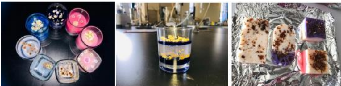
Gambar 10. Produk inovasi lilin CANDLETY dan sabun SOAPTY dari minyak adashasil kegiatan pengabdianmasyarakat di Desa Ngadisari-Probolinggo