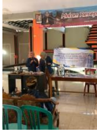
Gambar 8. Pelatihan lilin dan sabun adas