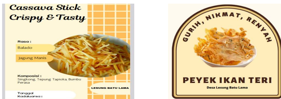
Gambar.1 Hasil Desain Produk

Pada pengoperasian aplikasi canva , kita sebagai pengguna tinggal mengembangkan kreativitas dalam mendesain. Dari kegiatan yang telah dilaksanakan oleh tim pengusul PKM di desa lesung batu lama, peserta sudah mampu untuk membuat desain kemasan produk, serta mengenai cara menggunakan fitur-fitur untuk promosi pemasaran produk, hal ini dapat dilihat dari gambar 4.1 dibawah ini: