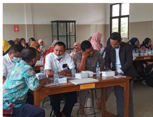
Gambar 2. Memetakan data

Pada tahap ini, peserta mengidentifikasi dokumen. Proses identifikasi meliputi: preodisassi, memilih data yang akan diidentifikasi berdasarkan tahun data yang akan dipilih, pengelompokan data sesuai dengan bidangnya seperti pelatihan kepemimpinan, kurikulum, atau yang lainnya, disesuaikan dengan data yang ada.