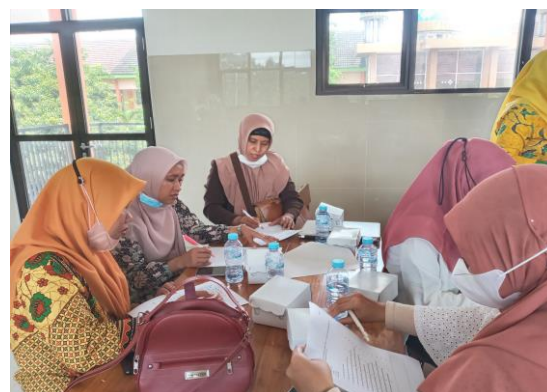
Gambar 1 pelaksanaan pre-tes Identifikasi Masalah

Langkah ini dilakukan untuk memastikan bahwa masalah yang dihadapi Guru Bahasa Inggris calon Penggerak betul-betul di diperoleh secara utuh dan spesifik. Instrument yang digunakan adalah pre-test.