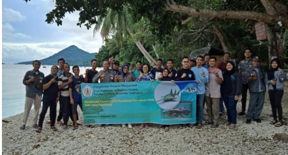
Gambar 3. Tim PKM dan peserta sosialisasi