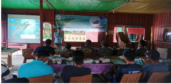
Gambar 2. Pelaksanaan kegiatan sosialisasi