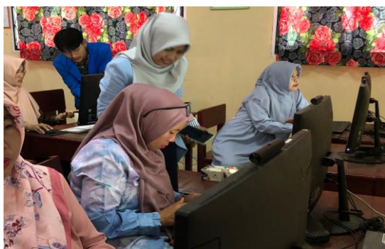
Gambar 3. Tim pemateri Membantu Guru yang mengalami kendala

Selanjutnya dilakukan evaluasi setelah pelaksanaan penggunaan aplikasi canva sebagai media pembelajaran.. Kegiatan ini mendapatkan apresiasi yang tinggi dari para peserta pelatihan dan dianggap sangat bermanfaat dalam meningkatkan proses pembelajaran.