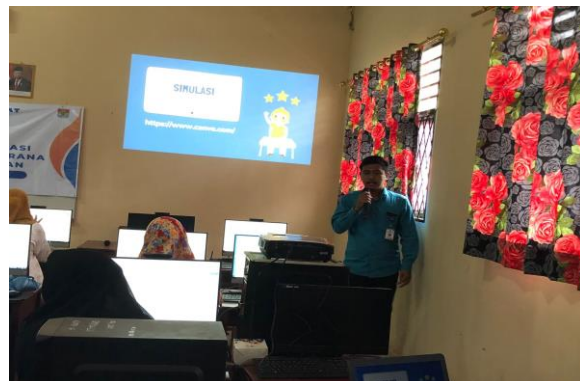
Gambar 2. Presentasi pemateri

Berikut adalah dokumentasi pemateri saat melaksanakan presentasi materi Canva Pada Gambar 2 .