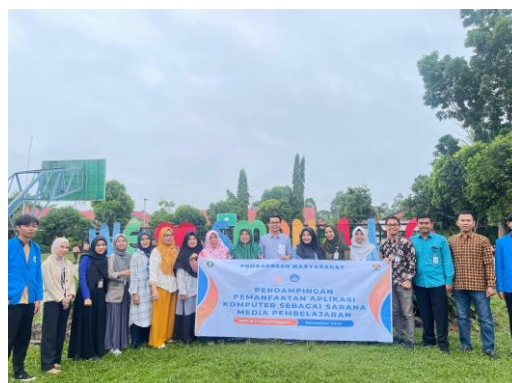
Gambar 4. Foto bersama tim pendampingan dan Peserta pelathan

Berikut adalah dokumentasi pemateri beserta tim dan peserta pelatihan yang di dampingi kepala sekolah, setelah melaksanakan kegiatan pengabdian kepada masyarakat di SMP Negeri 4 Lubuklinggau.