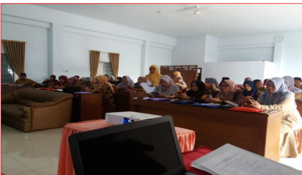
Gambar 1. Aktivitas Peserta dalam Praktik Mengimplementasi Bentuk dan Pilihan kata dalam Pelatihan KBI di Aula Hotel Mutiara Curup, Rabu, 10 April 2019.

Pelatihan KBI bidang bentuk dan pilihan kata ini telah menguatkan perubahan pola pikir ( mindset ) peserta dalam menggunakan bahasa Indonesia secara baik. Hasil pengamatan terhadap aktivitas guru bahasa Indonesia SMP/MTs dalam mengikuti pelatihan telah menunjukkan semangat dan antusiasme yang tinggi. Hasil rekaman kegiatan peserta menunjukkan aktivitas, bahwa dari awal kegiatan ( pretes ) berkategori aktif dan tinggi menjadi sangat aktif dan sangat tinggi ( postes ) diakhir kegiatan. Sebagaimana gamaran kegiatan peserta berikut ini.