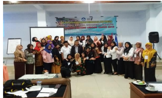
Gambar 2. Narasumber dan Kadis Pendidikan Kab. Rejang Lebong serta Peserta Pelatihan KBI bidang Bentuk dan Pilihan Kata foto bersama di Aula Hotel Mutiara Curup, Rabu, 10 April 2019.

dalam pelatihan (workshop) sebagai bentuk karakteristik yang ingin maju dalam belajar dan kinerjanya secara lebih baik. Kinerja aktif dalam mengelola proses pendidikan khususnya kemahiran berbahasa Indonesia menandakan peserta telah memiliki kompetensi atau kemahiran berbahasa Indonesia sesuai bidang keilmuannya. Dampak keberhasilan dari kegiatan ini diharapkan akan melahirkan sumber daya manusia (SDM) guru SMP/MTs yang berkarakter dan profesional.